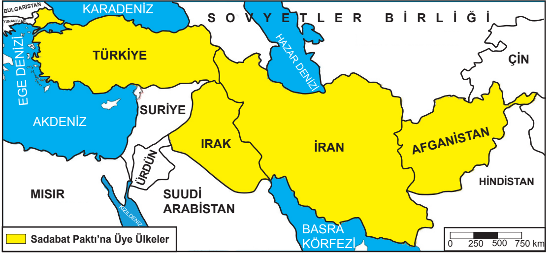
Sadabat Paktı'na Üye Ülkeler (8 Temmuz 1937)