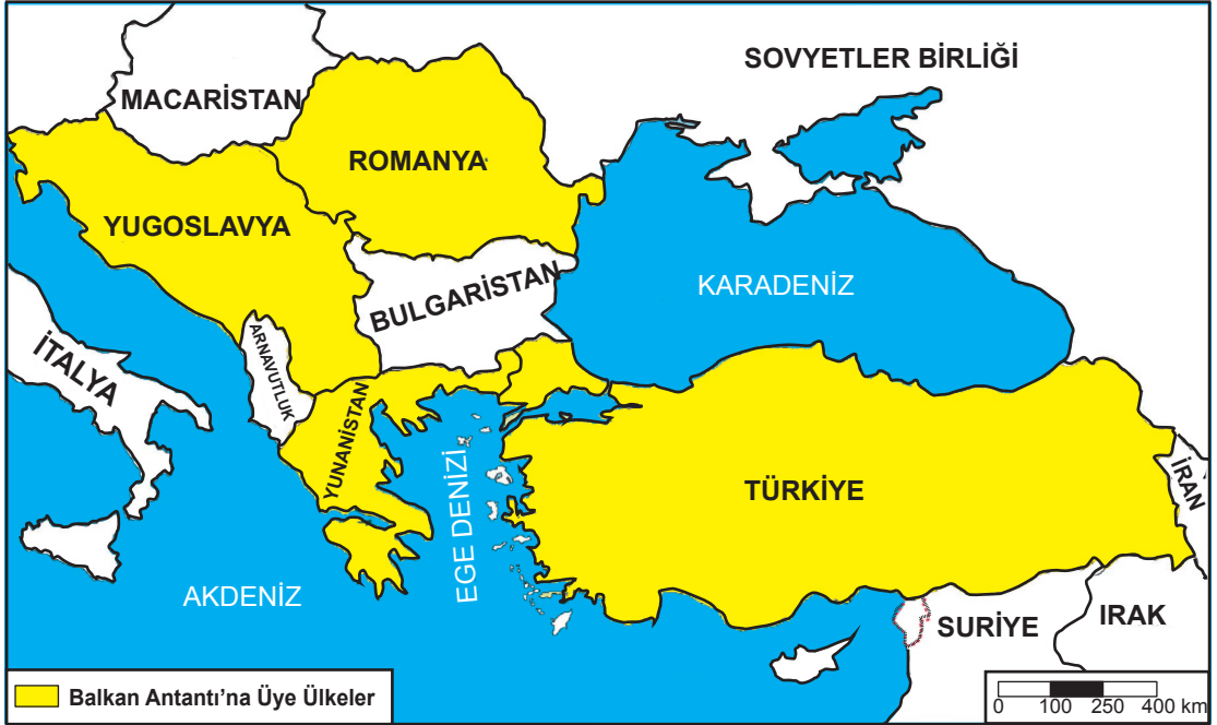
Balkan Antantı'na Üye Ülkeler (9 Şubat 1934)